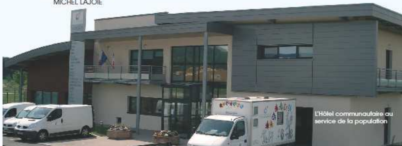
L'Hôtel communautaire au service de la population